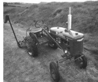
Farmall A með sláttuvél