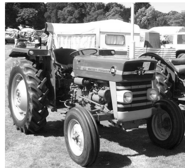
Massey Ferguson 135

En árin liðu og fram komu fleiri traktorar, með tímanum hætti Majorinn að vera sá stæsti og nýir og betur hannaðir traktorar komu fram á sjónarsviðið. Þetta voru traktorar eins og Massey Ferguson og Zetor. Sem dæmi um gríðarlegar vinsældir þessara traktora má nefna að á árunum